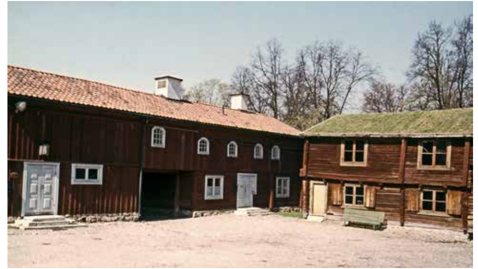
Vävaregården (till vänster) ligger idag bredvid Cajsa Wargshuset i Wadköping. Här på ett foto när kulturresevatet nyss tillkommit 1965.

I porten fanns en skylt på vardera väggen ”Tio kronor böter vid vite att här förorena”. På andra sidan porten mot söder i det gamla huset bodde familjen Pettersson. Gubben gick omkring och sågade