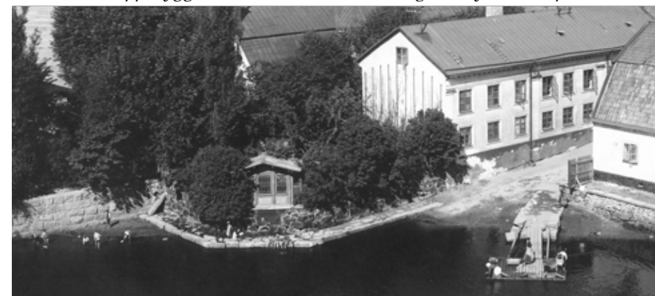
Det hårda jobbet att byka tvätt föll alltid på kvinnan, även om en man kan ses på övre bilden!