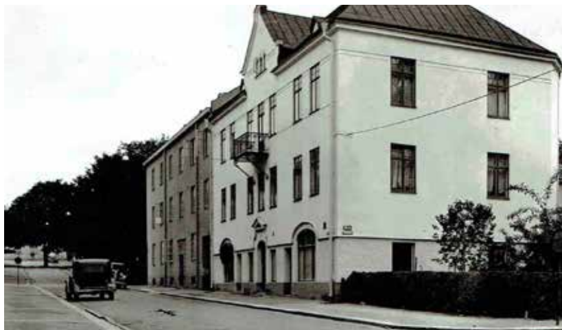
Hörnet Bondegatan – Jordgatan. Husen står ju kvar, men det som är intressant är att se Bondgatebacken till vänster.

Under tio år har vi här i medlemsbladet visat några av de 77 bilder som skänktes till Sällskapet Gamla Örebro 2015. Dessa togs alltså av en okänd amatörfotograf på 30-talet, och nu är vi framme vid bild 35 och 36.