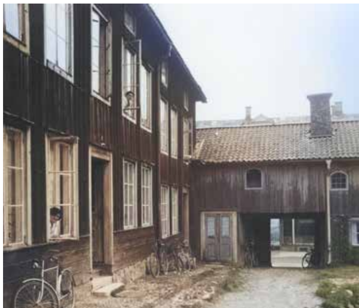
Nybygget, med två plan plus vind, var mycket högre än gatuhuset.

Rakt fram var det en dörr och så kom man ut i liksom en liten tambur i svalgången. Där bodde den gamla madam