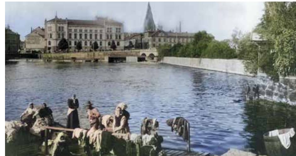
Tvätt- och klappbryggan vid Husarkasernen, i dag Henry Allards park.