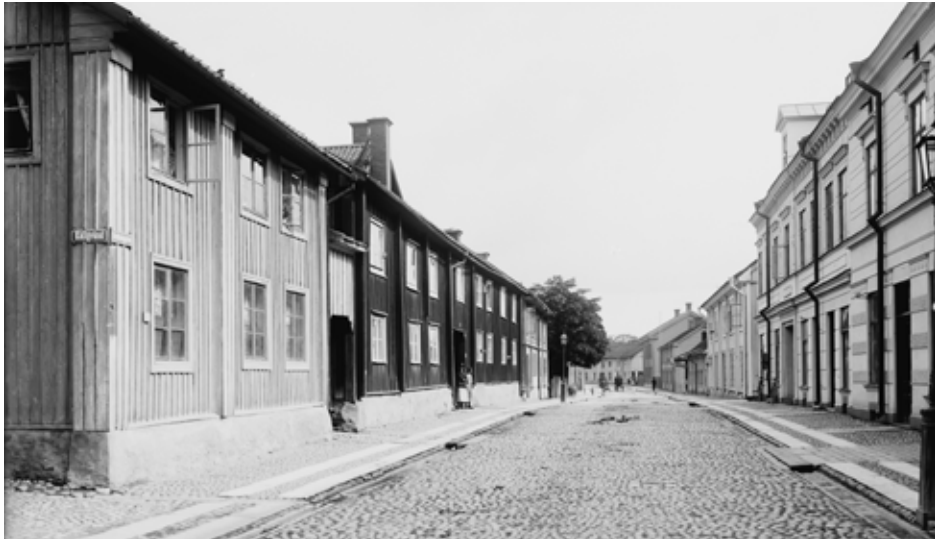
Drottninggatan 64 var det mörka (röda) huset mitt i bild. Foto: Bernhard Hakelner 1903

Larsson. Hennes man var död. Hon var nästan blind och var över 100 år. Hon sa alltid ”god dag” och så gick man ett par steg och så mötte man henne igen och då såg hon ju inte att det var samma person, så hon sa ”god dag” igen. Man tyckte hon var rolig för att hon hälsade så många gånger. Hon var väldigt rar i alla fall.