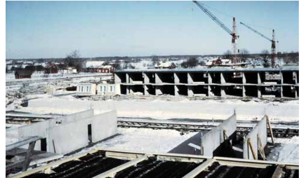
Bostadsbyggandet i full gång.

År 1963 utlystes en arkitekt-tävling och av 37 inkomna bidrag