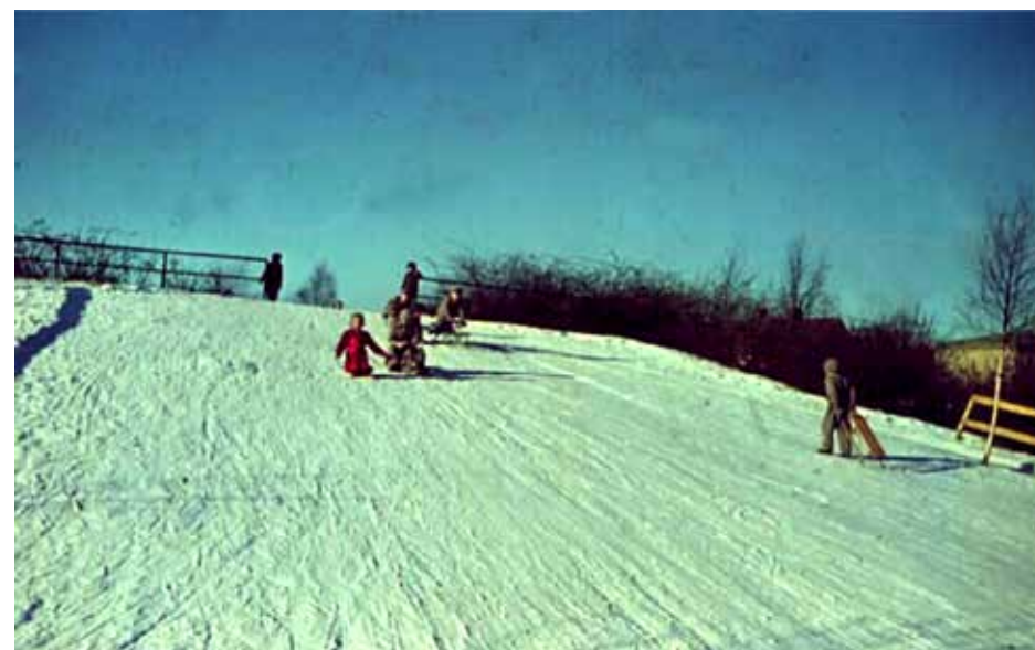
På väg utför Epa-kullen en vacker vinterdag