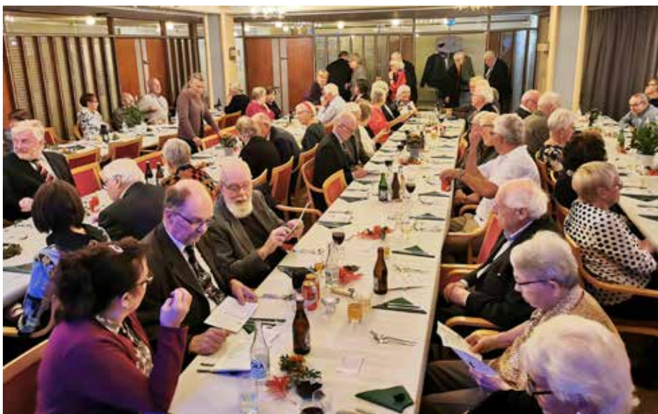
Fem långbord hade dukats upp i Hantverkshuset på vår bankett och cirka 90 personer trivdes.