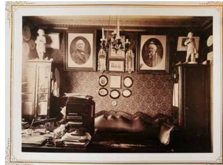
Bild ur fotoboken som visar interiörer från Söderlindhskagården.

och företagsamhet här hade gått i arv i flera led.