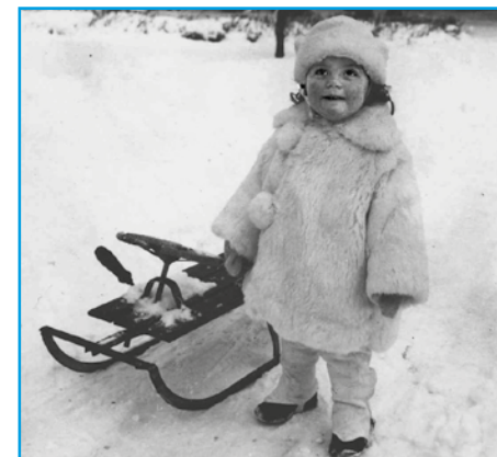
Dåtidens bobbåkare i kaninpäls och bobb med ratt och handbroms.

Det var Epa-kullen som var paradiset för kälke och bobb på den tiden, åtminstone för oss som bodde "på Öster". Den låg vid Sveaparken ganska nära Eyravallen. Hur den kom till vet