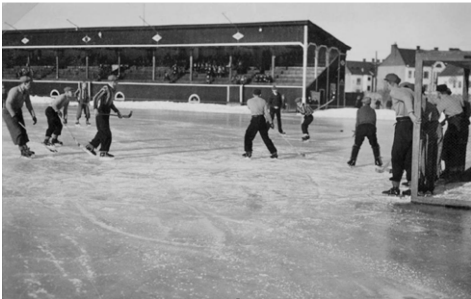
Bandy match på Eyravallen mot sittplatsläktaren.

jag tyvärr inte, det sägs att det var i samband med bygget av Idrotts huset. Men däremot vet jag varför den kallades Epa-kullen.