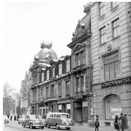
Edwalls hörna mot söder.