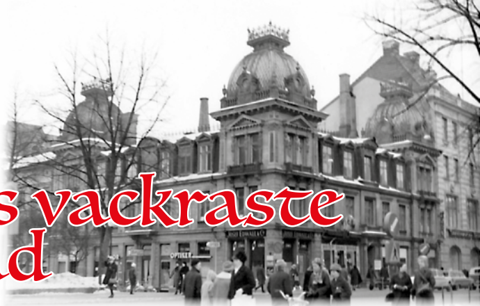
Edwalls hörna i början av 1960-talet.

I vårt arkiv finns många bilder. En del är oidentifierade och andra är utan uppgift om fotograf och tidpunkt. Dessa tre bilder som vi här visar verkar vara tagna vid samma tillfälle, av samma fotograf, som dock är okänd för oss. Tidpunkten går att bestämma till tidigt 60-tal och motivet är enkelt för oss.