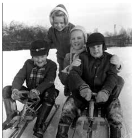
Barn på Epa-kullen 1956

sparade man också in entréavgiften. Det var jättebilligt att se matchen på det viset, och därför började man kalla den för Epa-kullen.