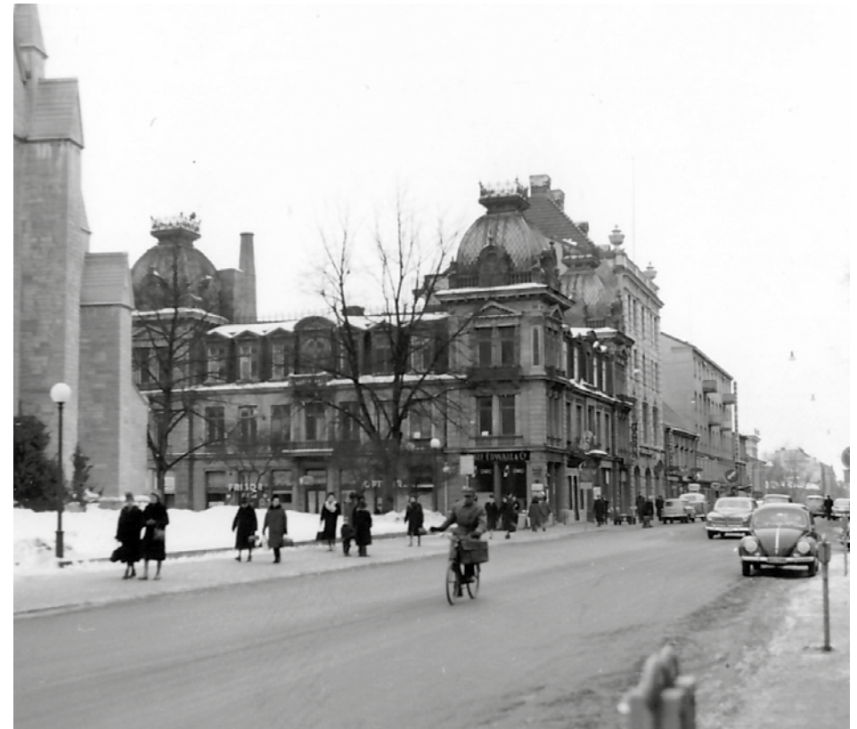
Trafik på Drottninggatan. Lägg märke till P-automaterna.

till sin far i Dalarna: ”Ännu är elden å de afbrunna tomterna icke slut, ej femton alnar från detta fönster hvari jag skrifer detta ryker det ej obetydligt, först i Måndags öppnade vi åter vår bod.”