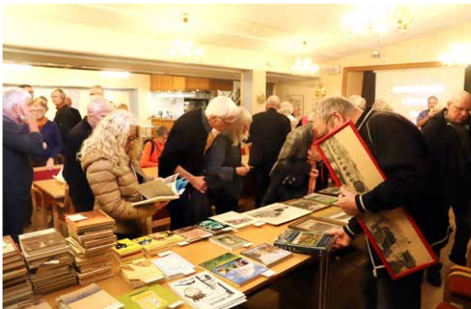
Inte bara jubileumsboken såldes på Öppet Hus, utan även många av våra be- gagnade böcker. Plus tavlor förstås. På vita duken visades Örebrofilmer.